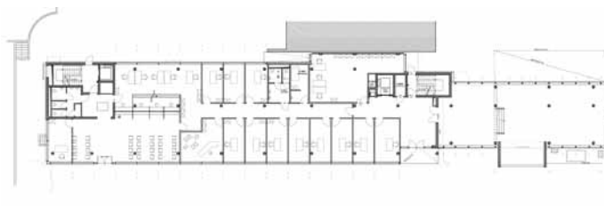
Rez-de chaussée, bât. O