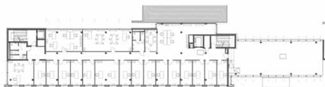
1er étage, bât. O